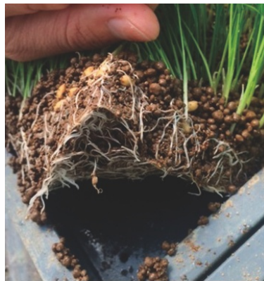
従来の育苗シート